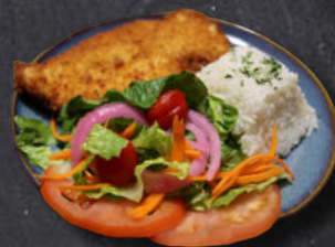
PEITO DE FRANGO À FIORENTINA

Peito de frango grelhado ou à milanesa, servido com arroz branco. A SUA ESCOLHA: purê de batata, legumes ou salada.