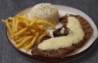
BABY BEEF | 4 QUEIJO

O bife mais popular do Brasil picanha grelhada com cebolas. Servido com arroz de alho e mandioca frita.