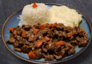
PICADINHO DE CARNE AO MOLHO CAMPESTRE

Filé de tilápia com molho de tomate cereja, alcaparras e cebola vermelha. Servido com arroz branco e legumes na manteiga.